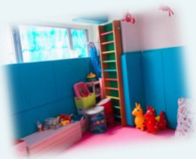
嬰幼兒運動感統房