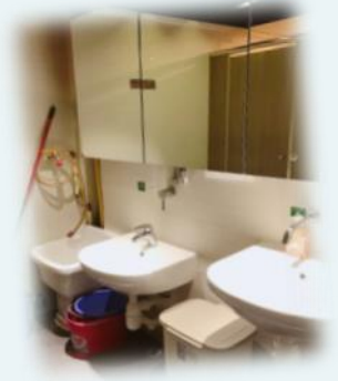
適合小朋友的洗手間